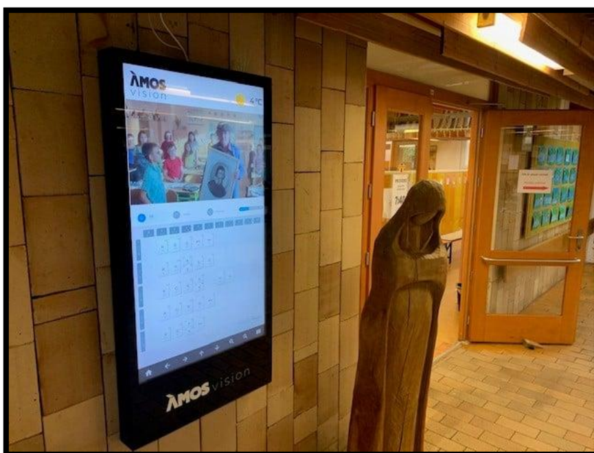
Školní informační portál Ámos vision (oficální spot Národních oslav)