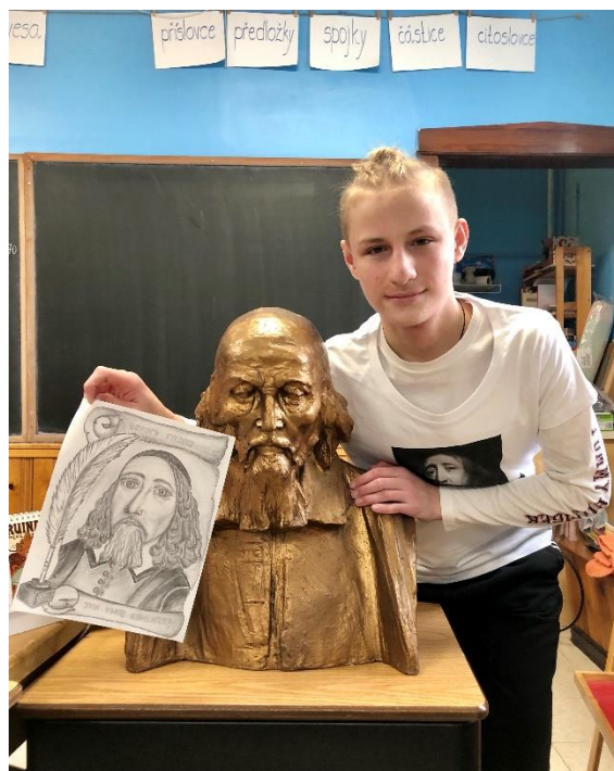
Česká škola T. G. Masaryka Chicago