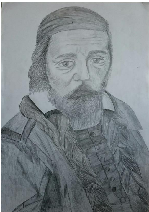
ZUŠ Mladá Boleslav