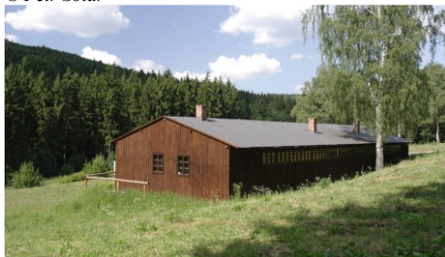
Hodonín, rekonstruovaný barák vězňů.

prvků dřevokaznými houbami se podařilo zachovat cca 20% původních prvků, a to zejména prvků viditelných z pohledu běžného návštěvníka. Současně byly v maximální míře vytěženy archivní doklady prokazující původní podobu rekonstruovaného objektu, které NPMK získalo výzkumem zejména v Národním archivu v Praze;