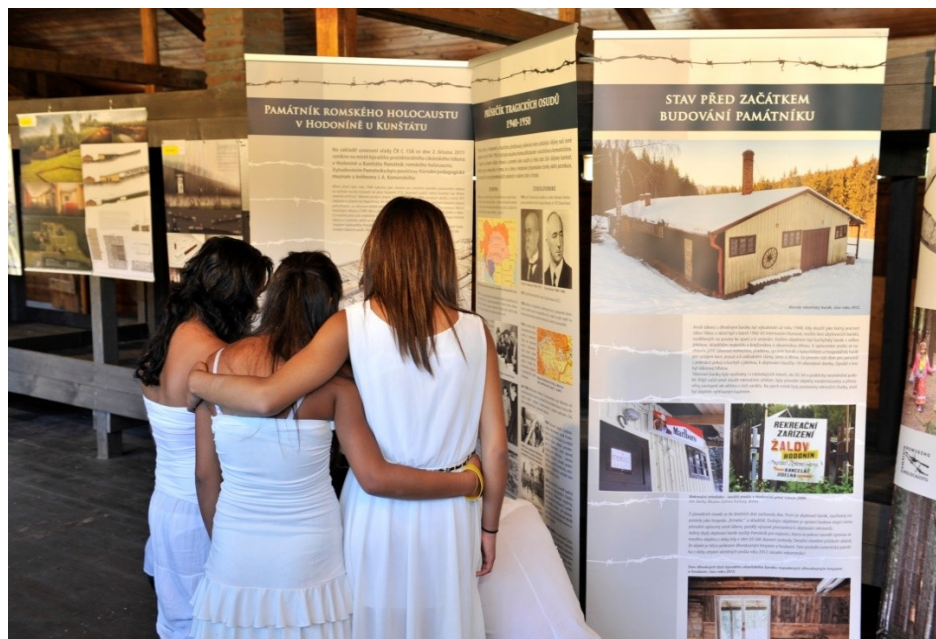
Prezentace výstavy Národního pedagogického muzea v rekonstruovaném vězeňském baráku v areálu tzv. cikánského tábora (budoucího Památníku) u příležitosti pietního shromáždění v srpnu 2013, které připomnělo 70. výročí od okamžiku, kdy byl z tzv. cikánského tábora v Hodoníně vypraven nejpčetnější transport romských vězňů do nacistického vyhlazovacího tábora Osvětim II-Březinka. Hodonín, rekonstruovaný barák vězňů.